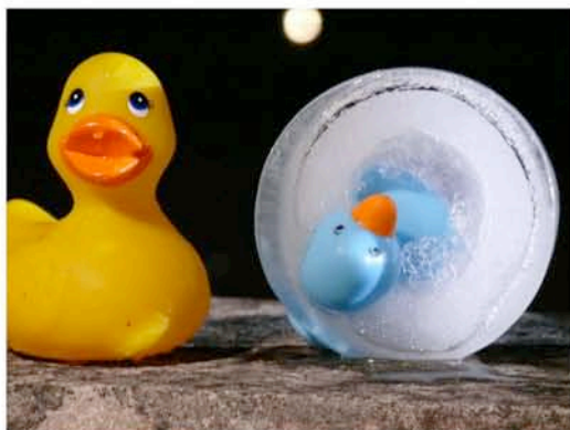
Extrait d' «A la recherche des canards perdus» (Frédéric Ferrer)

Tout part d'une incroyable histoire de canards en plastique perdus par la Nasa dans l'Arctique . Dans le but d'évaluer l'impact du changement climatique sur la fonte des glaces du pôle Nord, des scientifiques américains lâchent de faux palmipèdes sous un glacier, avec l'espoir de les voir ressortir de l'autre côté, dans la mer. Le lieu et la date de leur réapparition doit renseigner les chercheurs sur la vitesse de la fonte, et donc, sur les effets du réchauffement de la température. Sauf que, depuis septembre 2008, aucun des 90 spécimens n'a été retrouvé. Et depuis, la Nasa les recherche, en vain.