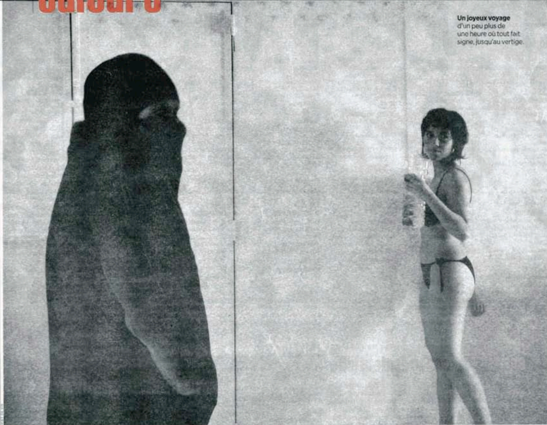
Un joyeux voyage d'un peu plus de une heure ou tout fait signe, jusqu'au vertige.

Mauvais Temps de Frédéric Ferrer, m. a. de l'auteur, aux anciennes cuisines de l'hôpital psychiatrique de Ville-Evrard, 202, av. Jean-Jaures, Neuilly-sur-Marne (93). A 20h30. Jusqu'au 6 avril. Rem. : 01 43 09 35 58.