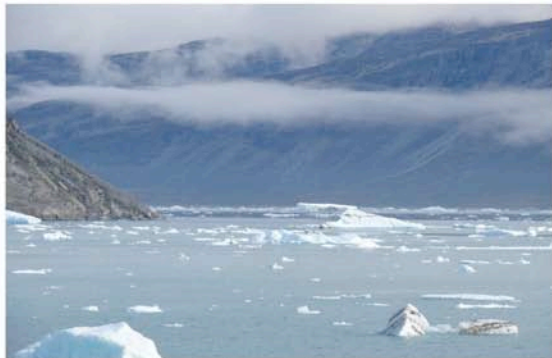
Extrait d' «A la recherche des canards perdus»