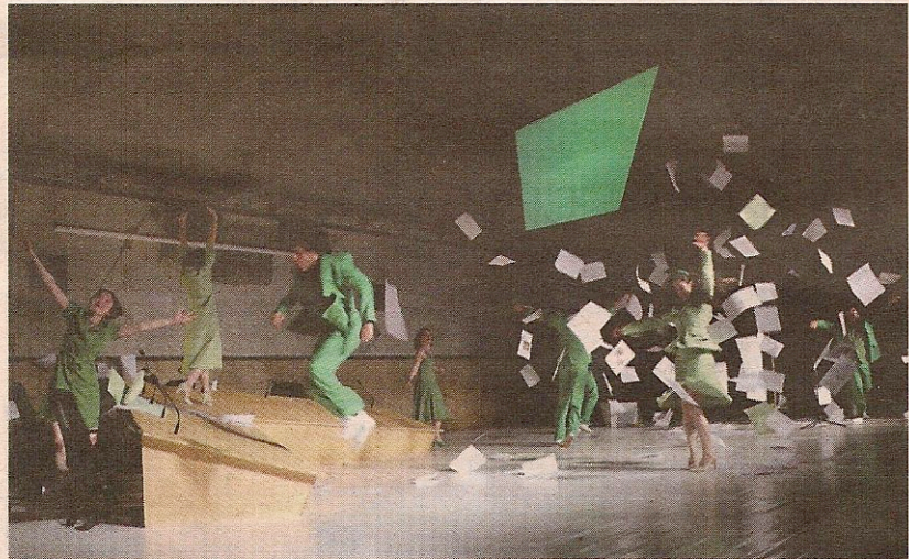
«Kyoto Forever».