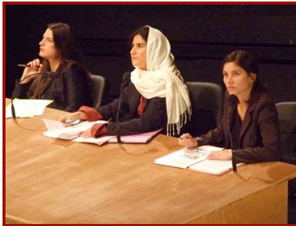
« Kyoto forever »